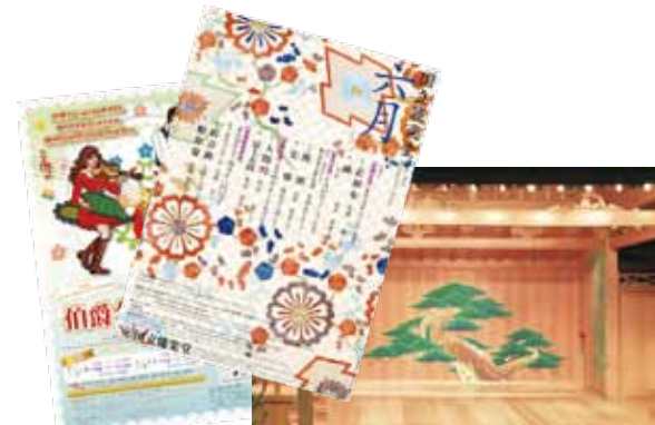
文化・芸術部会では、音楽会やお芝居の鑑賞、又お茶や絵画等の体験、各種イベントを企画しご参加していただけます。