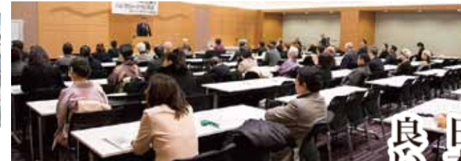
恒例のセミナーでは各分野での専門家をお招きしております。 於 衆議院第一議員会館。